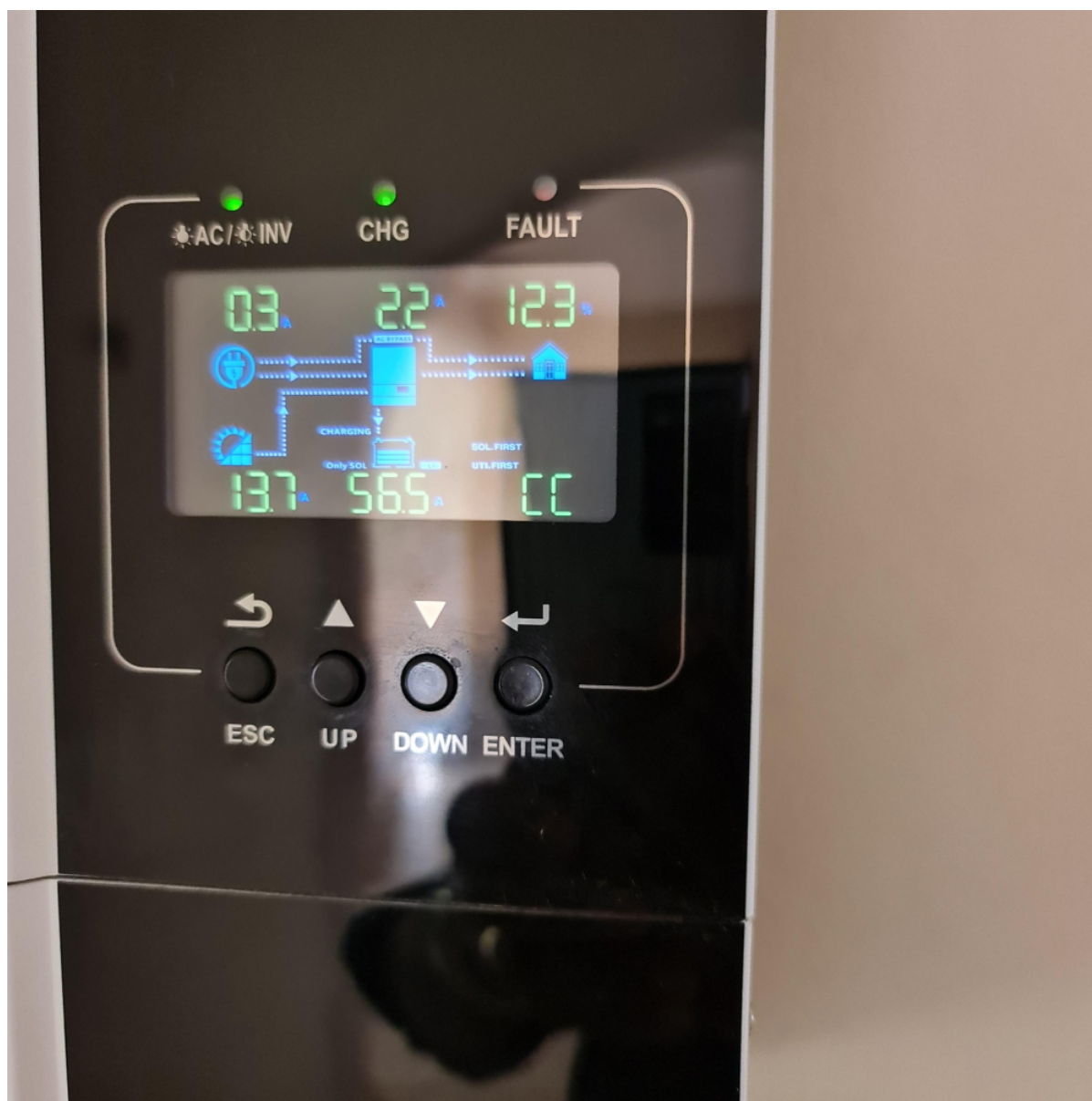
SPF 5000 ES verze (ilustrační foto)